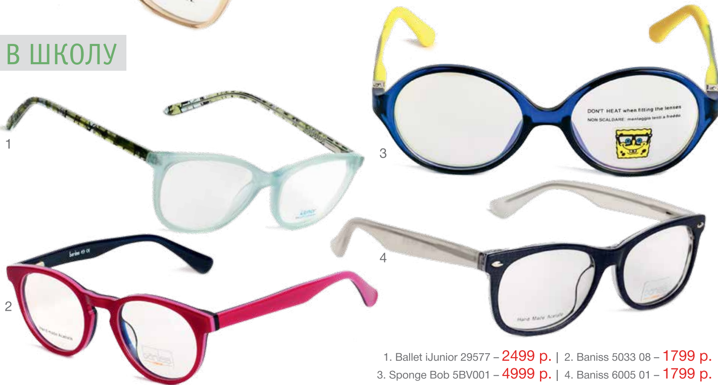
1. Ballet iJunior 29577 – 2499 р. | 2. Baniss 5033 08 – 1799 р. 3. Sponge Bob 5BV001 – 4999 р. | 4. Baniss 6005 01 – 1799 р.