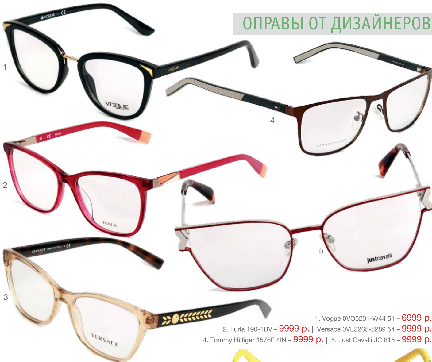
1. Vogue 0VO5231-W44 51 – 6999 р. 2. Furla 190-1BV – 9999 р. | Versace 0VE3265-5289 54 – 9999 р. 4. Tommy Hilfiger 1576F 4IN – 9999 р. | 5. Just Cavalli JC 815 – 9999 р.