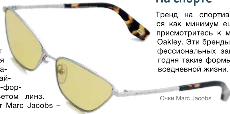
Очки Marc Jacobs

На радость модникам вернулись узкие очки из 90-х, а значит появилось поле для экспериментов с образами. Не останавливайтесь только на мини-форме, поиграйте с цветом линз. Например, желтый от Marc Jacobs – хит сезона.