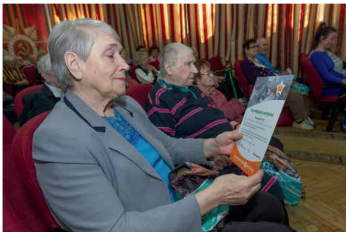
Праздник в Доме ветеранов на Крестовском острове (СПб)

«Счастливый взгляд» ежегодно проводит благотворительные и социальные акции для разных категорий граждан. Кстати, одна из них – «Здоровое зрение – здоровое поколение» – проходила осенью прошлого года в Санкт-Петербурге.