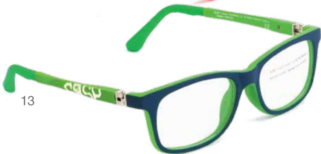
11. Salvo 510306 FXPS C2 – 999р. | 12. Ballet iJunior 29567 C6 – 1999р. 13. Sponge Bob SBV026 GRN 46-16-124 – 4999р.