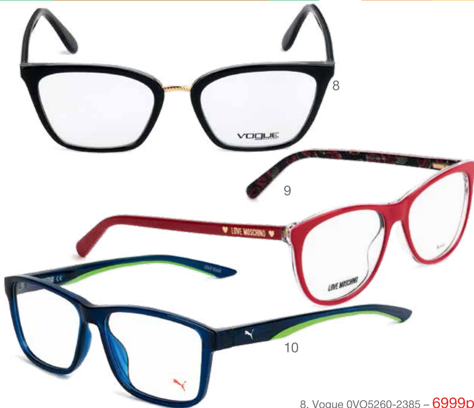
8. Vogue 0VO5260-2385 – 6999р. 9. Moschino Love 524-C9A – 9999р. | 10. Puma PU0207O-002 57 – 7999р.