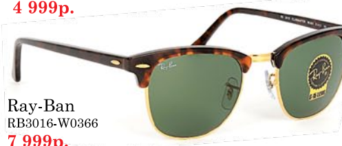
Ray-Ban RB3016-W0366 7 999р.