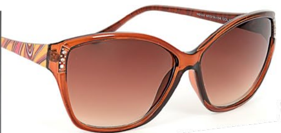
Nice 107-c1 1 999р.