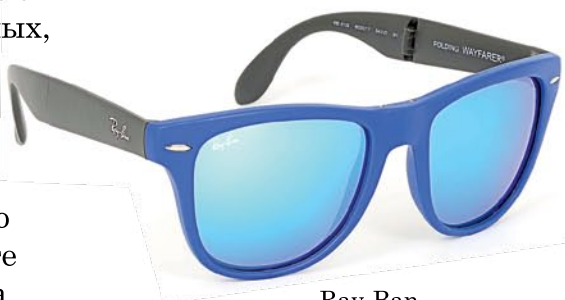
Ray-Ban RB4105-60201754 9 999р.