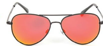
Polaroid P4139E 1 999р.