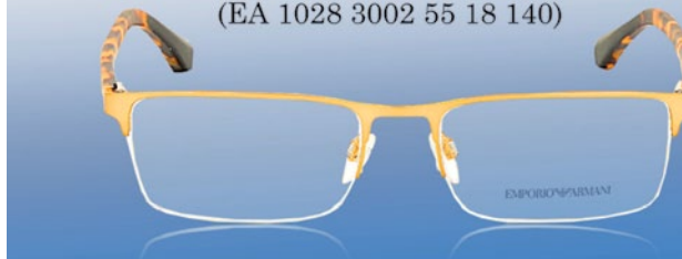
Оправа Emporio Armani (EA 1028 3002 55 18 140)

ВСЕ ОПРАВЫ, ИЛЛЮСТРАЦИИ КОТОРЫХ ИСПОЛЬЗОВАНЫ В ДАННОЙ СТАТЬЕ, ДОСТУПНЫ В ОПТИКЕ «СЧАСТЛИВЫЙ ВЗГЛЯД».