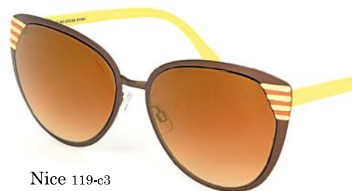
Nice 119-c3 1 999р.