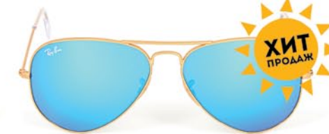
Ray-Ban RB3025-112/1758 9 999р.