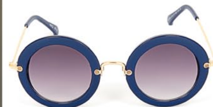
Nice 106-c2 1 999р.