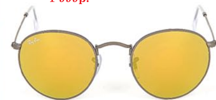
Ray-Ban RB3447-029/9350 9 999р.