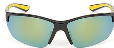
Polaroid Sport P7409-71C 1 999р.