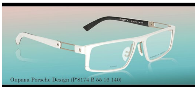
Оправа Porsche Design (P'S174 B 55 16 140)

Офисный стиль диктует строгий дресс-код? Выбирайте четкие геометрические линии во всем – особенно в форме оправы. Очки в стиле «хай-тек» из современных материалов, созданные по самым последним технологиям, всегда выглядят строго, дорого и презентабельно. С таким аксессуаром любая работа будет вам по плечу! Для создания нужного эффекта выбирайте в «Счастливом взгляде» металлические оправы из стали, алюминия, титана и кобальта – они гипоаллергенны и не подвержены коррозии.