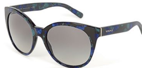
Versace 4286-51271157 9 999р.