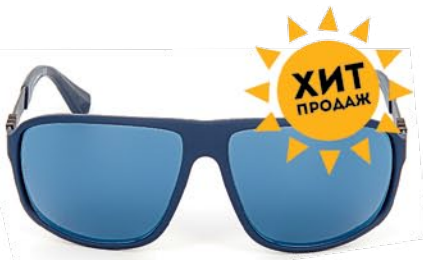
E.Armani 4029-50658064 8 999р.