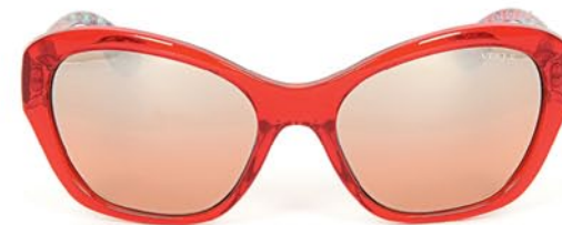
Vogue 2844S-21503657 5 999р.