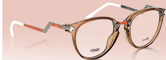
Оправа FENDI (FF 0039 BUG 135)

Люди, желающие подчеркнуть свой статус при выходе «в свет», должны остановить свой выбор на броских декоративных элементах, украшающих оправы – это могут быть стразы, кристаллы Svarovski или логотипы модных брендов. Для создания нужного эффекта выбирайте в «Счастливом взгляде» брендовые оправы с декоративными вставками и украшениями.