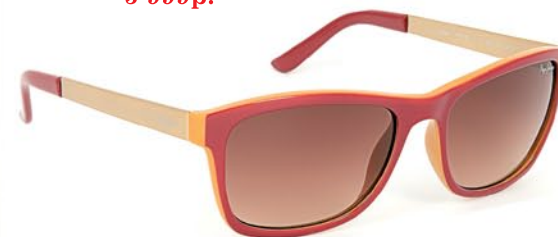
Pepe Jeans gabe 7182 c3 4 999р.