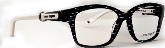
Оправа Laura Biagiotti (025 00 53 16-135 COL.00)

Из накачанного спортсмена в утонченного интеллектуала – думаете это возможно? Многие известные стилисты и дизайнеры знают, что очки способны не просто подчеркнуть форму лица или глубину взгляда, но и повысить IQ. Правильно подобранная оправа сделает из человека, который не любит читать, настоящего доктора наук! Для создания нужного эффекта выбирайте в оптике «Счастливый взгляд» классическую черно-белую оправу из пластика круглой или прямоугольной формы.