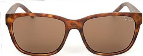
Pepe Jeans josh 7183 c2 4 999р.