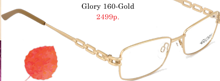
Glory 160-Gold 2499р.