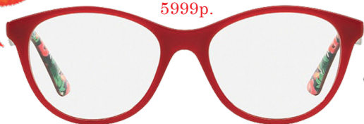
Vogue 2988-2340 5999р.