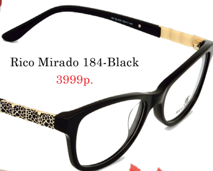
Rico Mirado 184-Black 3999р.