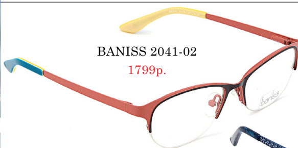
BANISS 2041-02 1799р.