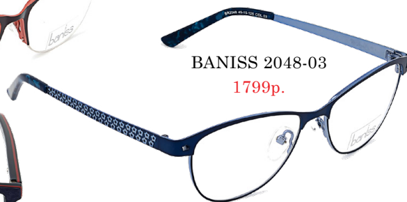
BANISS 2048-03 1799р.