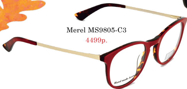
Merel MS9805-C3 4499р.