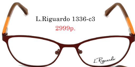
L.Riguardo 1336-c3 2999р.