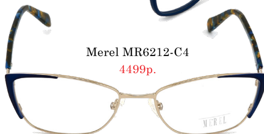
Merel MR6212-C4 4499р.