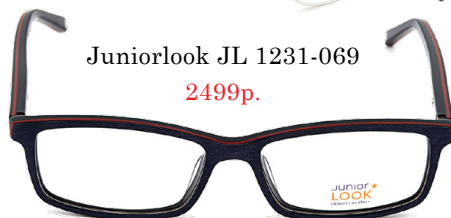
Juniorlook JL 1231-069 2499р.