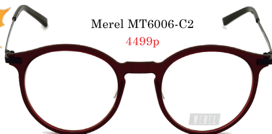
Merel MT6006-C2 4499р.