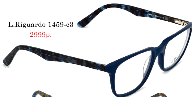
L.Riguardo 1459-c3 2999р.