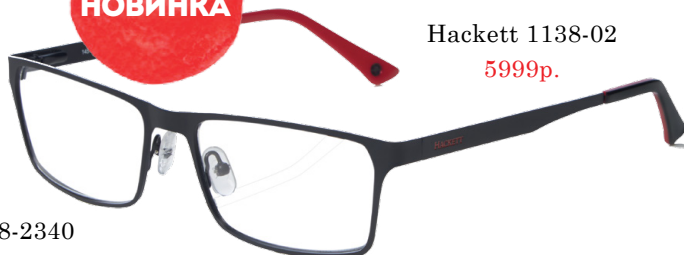
Hackett 1138-02 5999р.