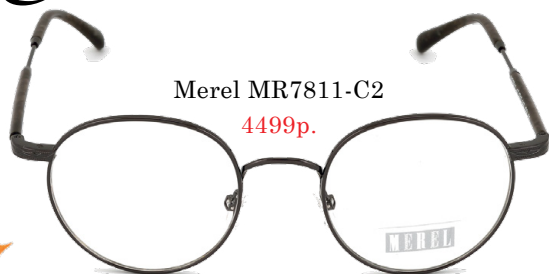
Merel MR7811-C2 4499р.