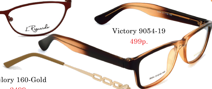
Victory 9054-19 499р.